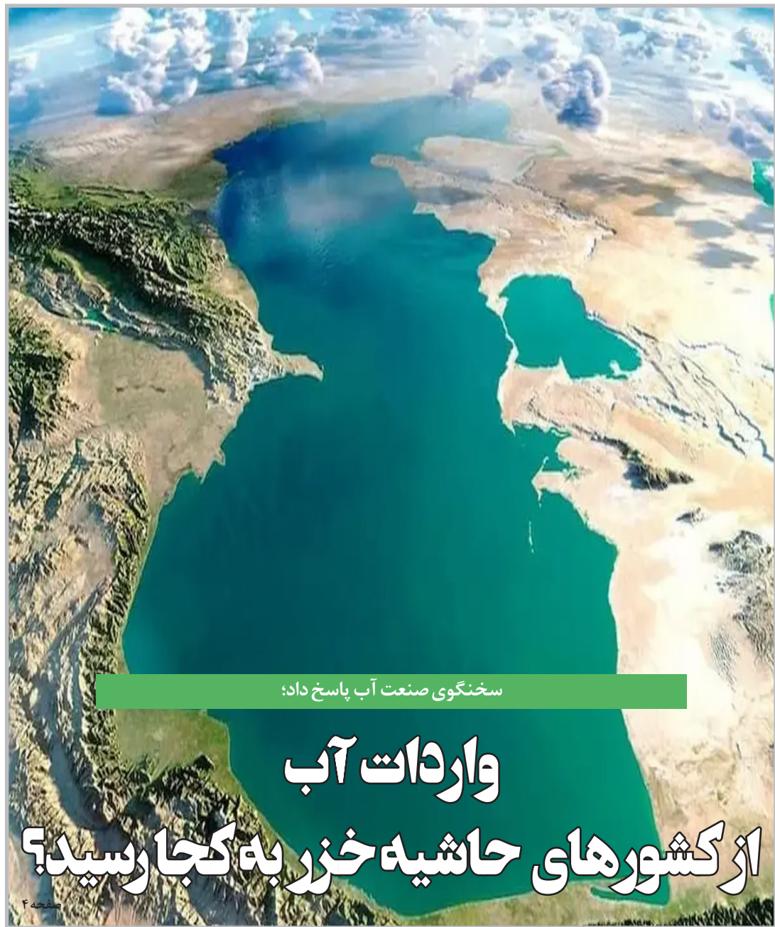
سختگویی صنعت آب پاسخ داد؛